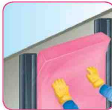
Presione hacia la cavidad.