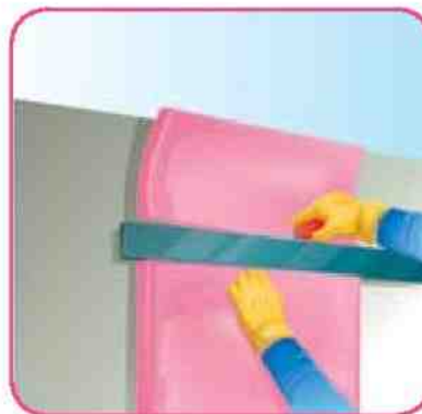
Corte el material excedente con una navaja o cuchillo con filo.

"Owens Corning proporciona estas instrucciones "tal y como están" y renuncia a cualquier responsabilidad por cualquier falta de precisión, omisión, error tipográfico causado por el equipo de terceras personas. Al utilizar estas recomendaciones, usted está aceptando estar sujeto a las disposiciones contenidas en este párrafo. Estas recomendaciones proporcionan un método ilustrativo para instalar Aislhogar y/o accesorios de Owens Corning. Las instrucciones de Owens Corning no tienen por objeto resolver toda contingencia posible que pudiera presentarse durante la instalación ni recomendar el uso de una herramienta en particular. Por la presente, Owens Corning renuncia expresamente a toda responsabilidad por cualquier reclamación por lesiones o fallecimiento relacionados o derivados por el uso de estas recomendaciones de instalación y de otras instrucciones de instalación que Owens Corning haya proporcionado de alguna otra forma".